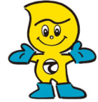
産業廃棄物適正処理のマスコット「てき丸君」