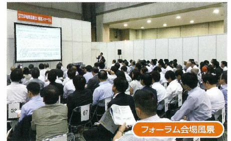
フォーラム会場風景

Mail: forum@nippo-biz.co.jp (問い合わせ専用。メールによる申込受付は行っていません。)