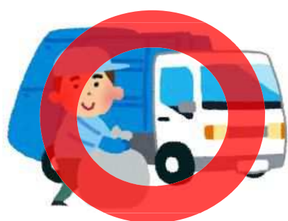
市町村の指定する方法