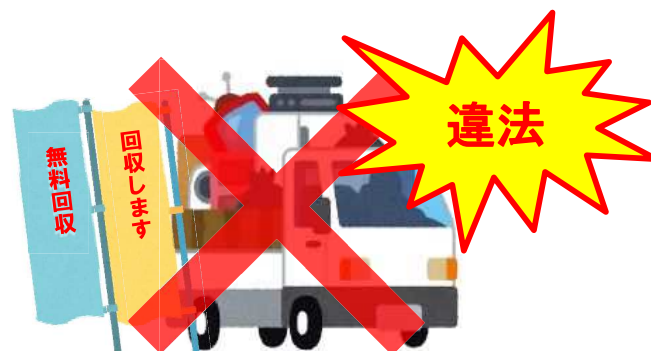
解体業者、不要品回収業者等（一般廃棄物処理業の許可なし）が回収